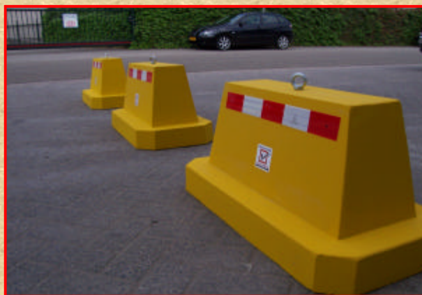
Gemaakt van gewapend glasvezelversterkt beton

Uiterst geschikt voor "tijdelijke" wegafzettingen.