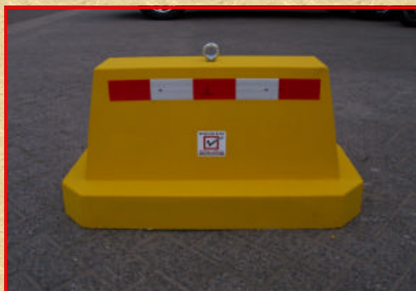
Lengte 800 x Breedte 400 x Hoogte 400 mm 175 kg.