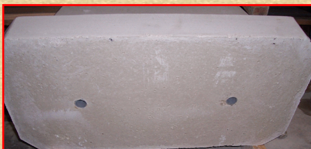
Aan onderzijde voorzien van 2 openingen t.b.v. verankering.

Uiterst geschikt voor "tijdelijke" wegafzettingen.