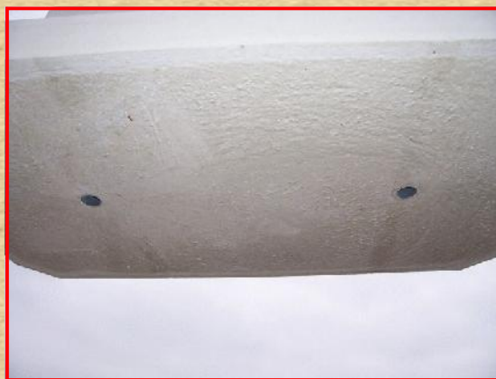
Aan onderzijde voorzien van 2 openingen t.b.v. verankerung. Dit middels (roestvrij)stalen ankerpennen.