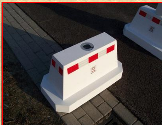
Lengte 800 x Breedte 400. Totaalhoogte 400 mm. 175 kg.