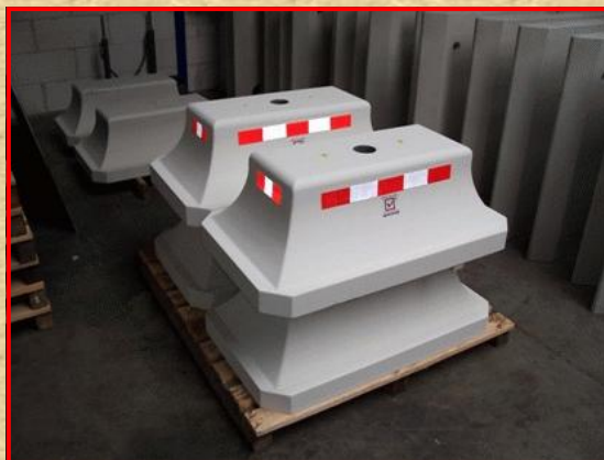
Lengte 1000 x Breedte 600. Totaalhoogte 330 mm. 320 kg.