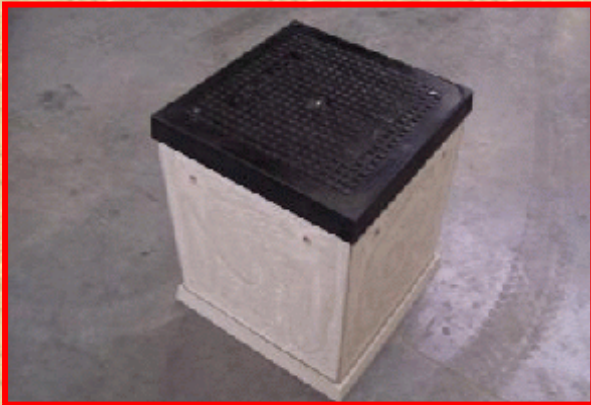
Prefab betonput L500 x B500 x H630 met deksel