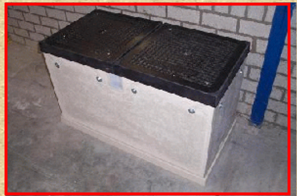
Prefab betonput L1000 x B500 x H630 met 2 deksels